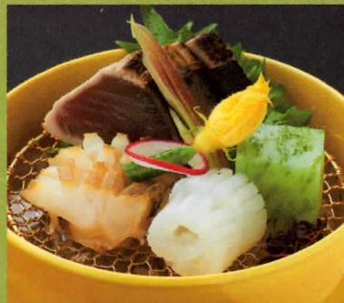
青き蒟蒻と夏旬魚三種盛