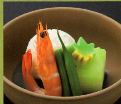
冬瓜と有頭海老の冷鉢