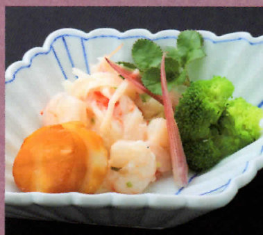
天然エビと帆立スモークサラダ仕立て