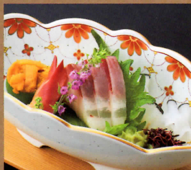
秋旬魚の造り尾羽毛添え