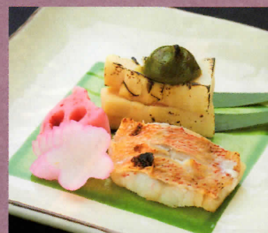
カサゴ若狭焼と筍田楽