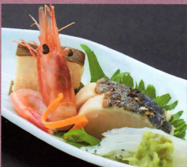
湯葉昆布めと春旬魚のお造り