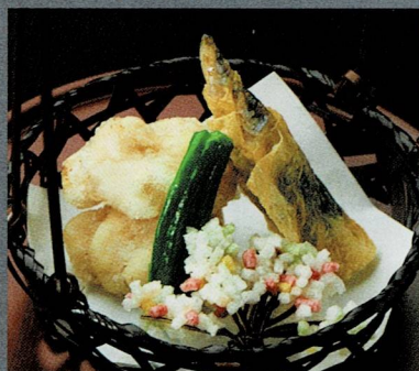
公魚と白子変り揚げ